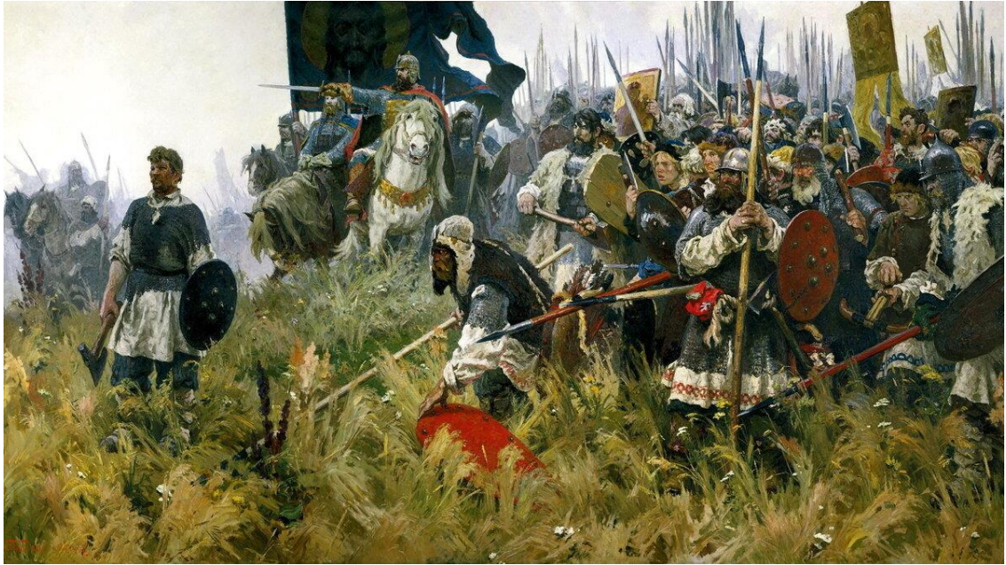
Александр Бубнов. «Утро на Куликовом поле»

8 сентября 1380 г. состоялась сражение между русским войском под командованием московского князя Дмитрия Ивановича и монгольским, которое возглавил Мамай. Сокрушительную победу в этой битве одержала объединенное русское войско, силы монгол были разбиты, и обращены в бегство. Но, несмотря на эту победу, Русь оставалась в зависимости от Золотой Орды еще сто лет. Выявите не менее двух причин, почему не удалось сбросить монгольское иго после Куликовского сражения. Ответ оформите в виде эссе.