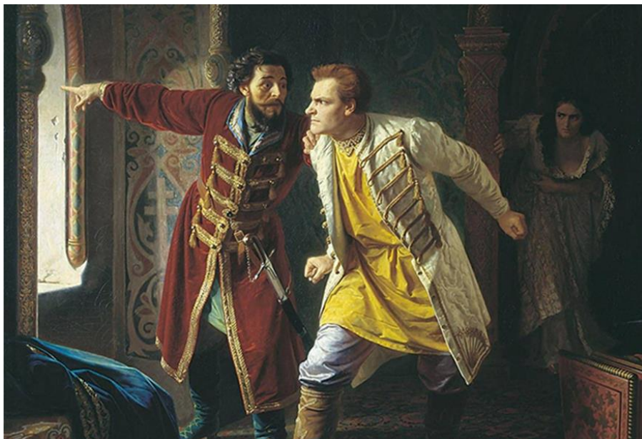
Карл Вениг «Последние минуты Дмитрия Самозванца»